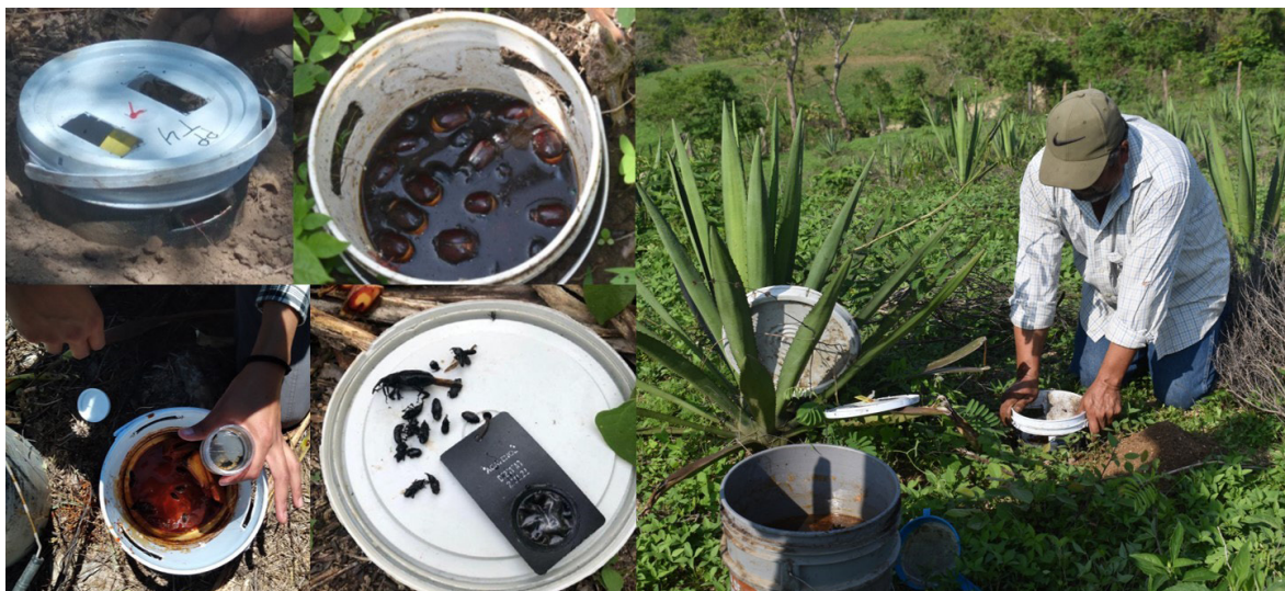
Figura 4. Trampeo de las plagas Scyphophorus acupunctatus y Strategus aloeus

cada monitoreo y se están tomando algunas mediciones a los escarabajos. Esta información nos permitirá tener un mayor conocimiento de la dinámica poblacional de estas plagas en las mezcaleras de la región y con ello poder proponer mejores estrategias para su manejo agroecológico.