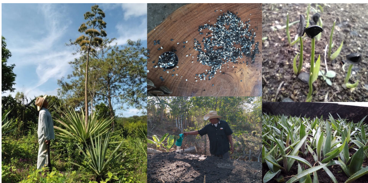
Figura 6. Propagación por semilla de variedades locales de agave

de diversidad genética de las variedades de agaves locales. Ha sido de suma importancia el diálogo academia-instituciones-comunidad respecto a los beneficios de esta práctica. El acompañamiento en la selección y monitoreo de plantas de diferentes variedades para la obtención de semillas, así como en el proceso de germinación y el cuidado de las plántulas constituyeron una parte importante del trabajo con las familias. Cabe señalar, que el intercambio de experiencias entre los propios productores respecto a esta actividad es lo que ha generado mayor interés en otros manejadores de agave por comenzar a experimentar con esta estrategia.