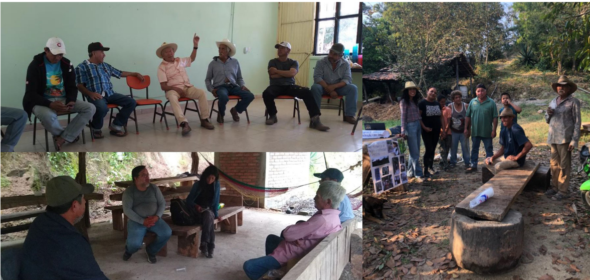
Figura 7. Fortalecimiento del tejido social a través del diálogo de saberes, intercambios de experiencias y evaluaciones participativas

Esta estrategia ha funcionado de manera transversal a todas las prácticas anteriores. Fortalecer el tejido social se posibilita desde el propio modelo de la IAP, al impulsar el proceso de aprendizaje a través de la creación de una comunidad de personas con ese fin. Los talleres participativos, el diálogo de saberes, los intercambios de experiencias y las evaluaciones participativas han sido pequeños espacios de acercamiento y encuentro entre los productores (Figura 7) en donde, a pesar de las diferencias personales, se crean colaboraciones desde las afinidades. Estas interacciones han facilitado que se trabaje en colectivo en algunas prácticas, lo cual consideramos ha sido un valioso avance.