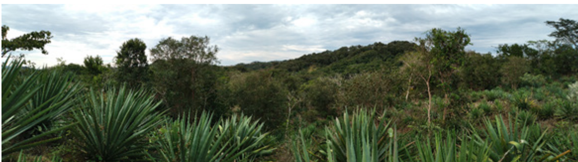
Figura 1. Mezcalera agroforestal (cada vez más escasas) en la localidad de Chacala, Cabo Corrientes, Jalisco

En la costa de Jalisco, las mezcaleras 1 con manejo agroforestal son cada vez más escasas (Figura 1). La acelerada expansión de la frontera agrícola de los monocultivos de Agave angustifolia y A. rhodacantha ha arrasado principalmente con los bosques tropicales subcaducifolios de la región. Además, ha ocasionado el desplazamiento de los pequeños productores, en particular de aquellos que sostenían la producción de raicilla de la costa en diferentes comunidades del municipio de Cabo Corrientes, antes del decreto de la Denominación de Origen Raicilla (DOR).