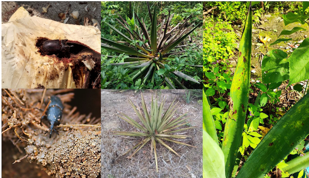
Figura 2. Principales plagas y enfermedades en los agaves raicilleros de la costa de Jalisco

A partir de octubre de 2021 se inició la creación de la comunidad de aprendizaje con manejadores de agave y pequeños productores de raicilla de la costa. Se realizó un diagnóstico participativo en donde se identificaron los principales problemas en torno a las mezcaleras de la región. La alta presencia de plagas y enfermedades en los agaves fueron las problemáticas señaladas de mayor importancia (Figura 2), la cual se enfatizó con la frase “sin mezcal, no hay raicilla”.