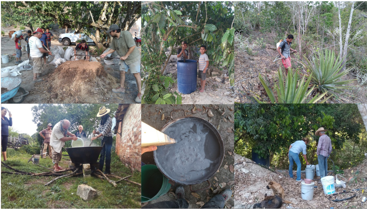
Figura 5. Talleres de elaboración y aplicación de caldos minerales y biofertilizantes

A través de esta experiencia de IAP se han enfocado esfuerzos en promover la importancia del manejo de las plantas enfermas y de la prevención de problemas fitosanitarios. Las dificultades organizativas, la poca disponibilidad de tiempo y de fuerza de trabajo en la comunidad, son temas que es importante analizar y mejorar para lograr reducir los problemas fitosanitarios actuales y avanzar en la transición agroecológica de las mezcaleras. Esto último cobra mayor importancia ante el creciente establecimiento de plantaciones de agave en la región y los problemas socioecológicos que pueden ocasionar sin planes de manejo adecuados.