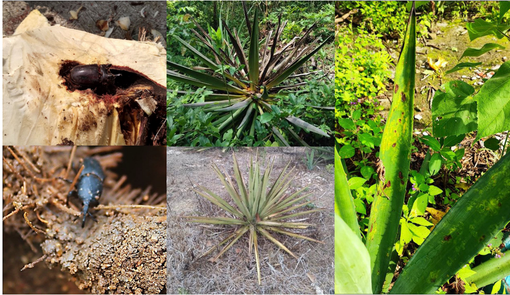
Figura 2. Principales plagas y enfermedades en los agaves raicilleros de la costa de Jalisco

Esta experiencia de IAP se desarrolló en dos etapas, con ciclos consecutivos de acción – reflexión/sistematización, a manera de espiral, entre procesos de evaluación/cosecha y creación de planes de acción (Figura 3).