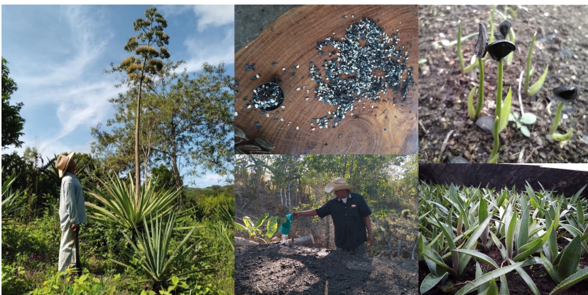
Figura 6. Propagación por semilla de variedades locales de agave

En primer lugar, se ha promovido la preservación de diferentes variedades de mezcal, a través de la propagación de agaves nativos por semilla (Figura 6). En la región se realiza la propagación de agaves casi exclusivamente a través de hijuelos y está muy enfocada a la selección de variedades de crecimiento rápido, en especial la variedad conocida como “mezcal amarillo”. La práctica de germinación de agaves en este proceso, tiene el objetivo de disminuir la dispersión de plagas y enfermedades a través de hijuelos a nuevas plantaciones y para evitar la pérdida de diversidad genética de las variedades de agaves locales. Ha sido de suma importancia el diálogo academia-instituciones-comunidad respecto a los beneficios de esta práctica. El acompañamiento en la selección y monitoreo de plantas de diferentes variedades para la obtención de semillas, así como en el proceso de germinación y el cuidado de las plántulas constituyeron una parte importante del trabajo con las familias. Cabe señalar, que el intercambio de experiencias entre los propios productores respecto a esta actividad es lo que ha generado mayor interés en otros manejadores de agave por comenzar a experimentar con esta estrategia.