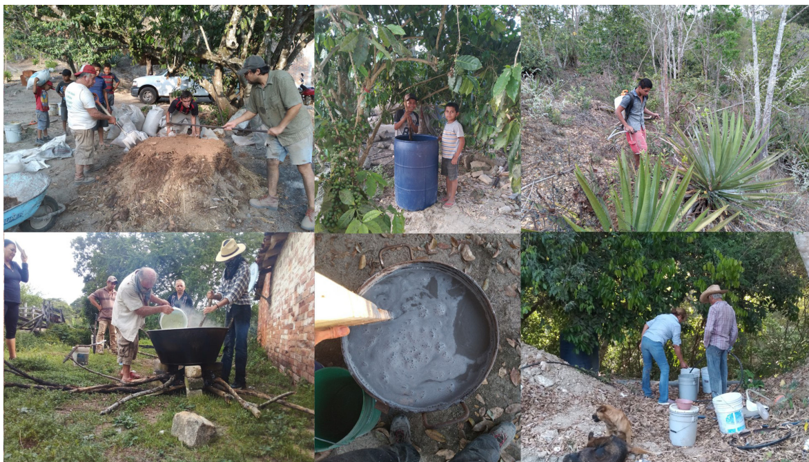
Figura 5. Talleres de elaboración y aplicación de caldos minerales y biofertilizantes

A través de esta experiencia de IAP se han enfocado esfuerzos en promover la importancia del manejo de las plantas enfermas y de la prevención de problemas fitosanitarios. Las dificultades organizativas, la poca disponibilidad de tiempo y de fuerza de trabajo en la comunidad, son temas que es importante analizar y mejorar para lograr reducir los problemas fitosanitarios actuales y avanzar en la transición agroecológica de las mezcaleras. Esto último cobra mayor importancia ante el creciente establecimiento de plantaciones de agave en la región y los problemas socioecológicos que pueden ocasionar sin planes de manejo adecuados.