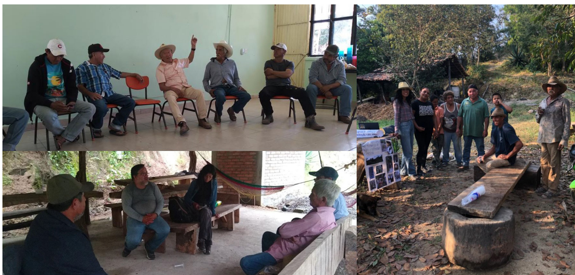
Figura 7. Fortalecimiento del tejido social a través del diálogo de saberes, intercambios de experiencias y evaluaciones participativas

Esta estrategia ha funcionado de manera transversal a todas las prácticas anteriores. Fortalecer el tejido social se posibilita desde el propio modelo de la IAP, al impulsar el proceso de aprendizaje a través de la creación de una comunidad de personas con ese fin. Los talleres participativos, el diálogo de saberes, los intercambios de experiencias y las evaluaciones participativas han sido pequeños espacios de acercamiento y encuentro entre los productores (Figura 7) en donde, a pesar de las diferencias personales, se crean colaboraciones desde las afinidades. Estas interacciones han facilitado que se trabaje en colectivo en algunas prácticas, lo cual consideramos ha sido un valioso avance.